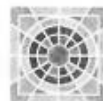
DIP. JESUS PORTILLO HERRERA PRESIDENTE DE LA COMISIÓN DE PROTECCIÓN CIVIL, SEGURIDAD PÚBLICA, PREVENCIÓN Y REINSERCIÓN SOCIAL