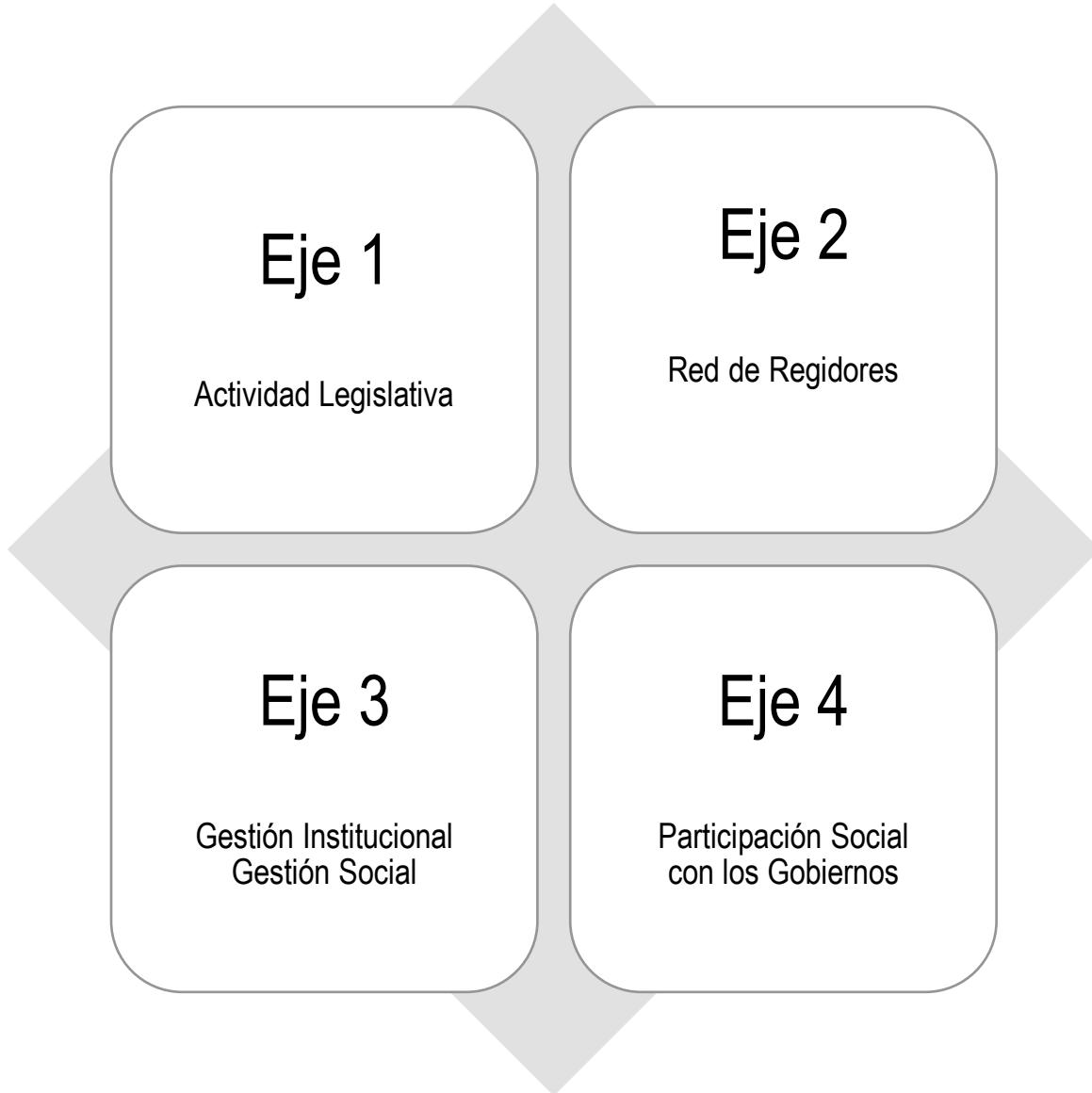
Gráfica: Ejes Operativos de Organización de la Comisión de Derechos Humanos, Grupos Vulnerables, Derechos de Niñas, Niños y Adolescentes de la LXIII Legislatura del Congreso del Estado de Tlaxcala.