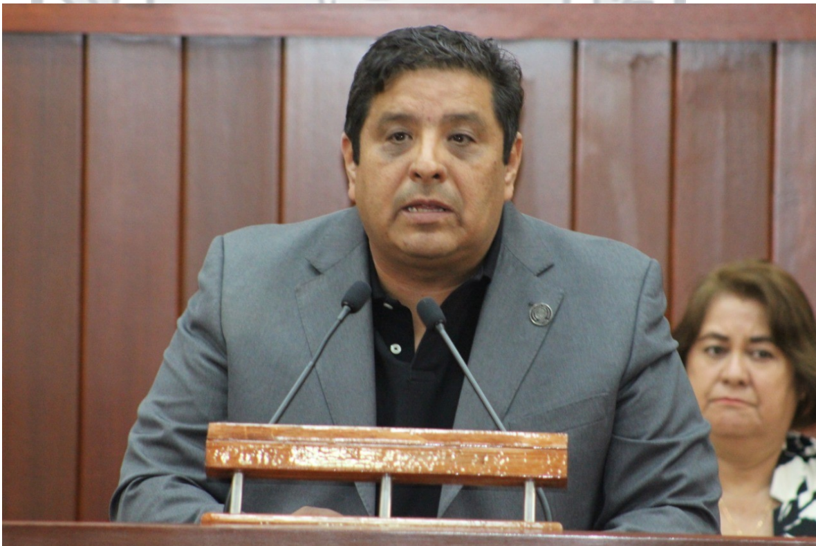
CONTROL DE ASISTENCIAS

Segundo Periodo Ordinario de Sesiones Segundo Año de Ejercicio Legal, comprendido del 15 de enero al 30 de mayo de 2020 LXIII Legislatura 17 de marzo 2020 Núm. de Gaceta: LXIII17032020