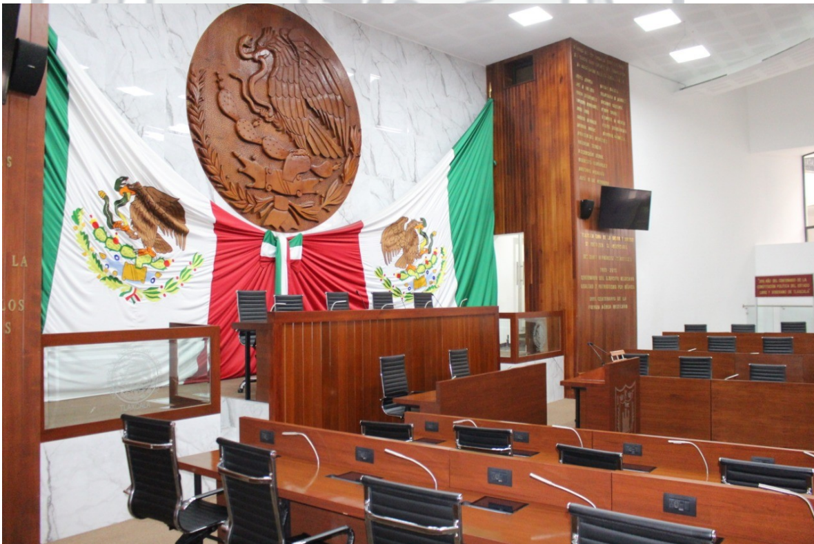
CONTROL DE ASISTENCIAS