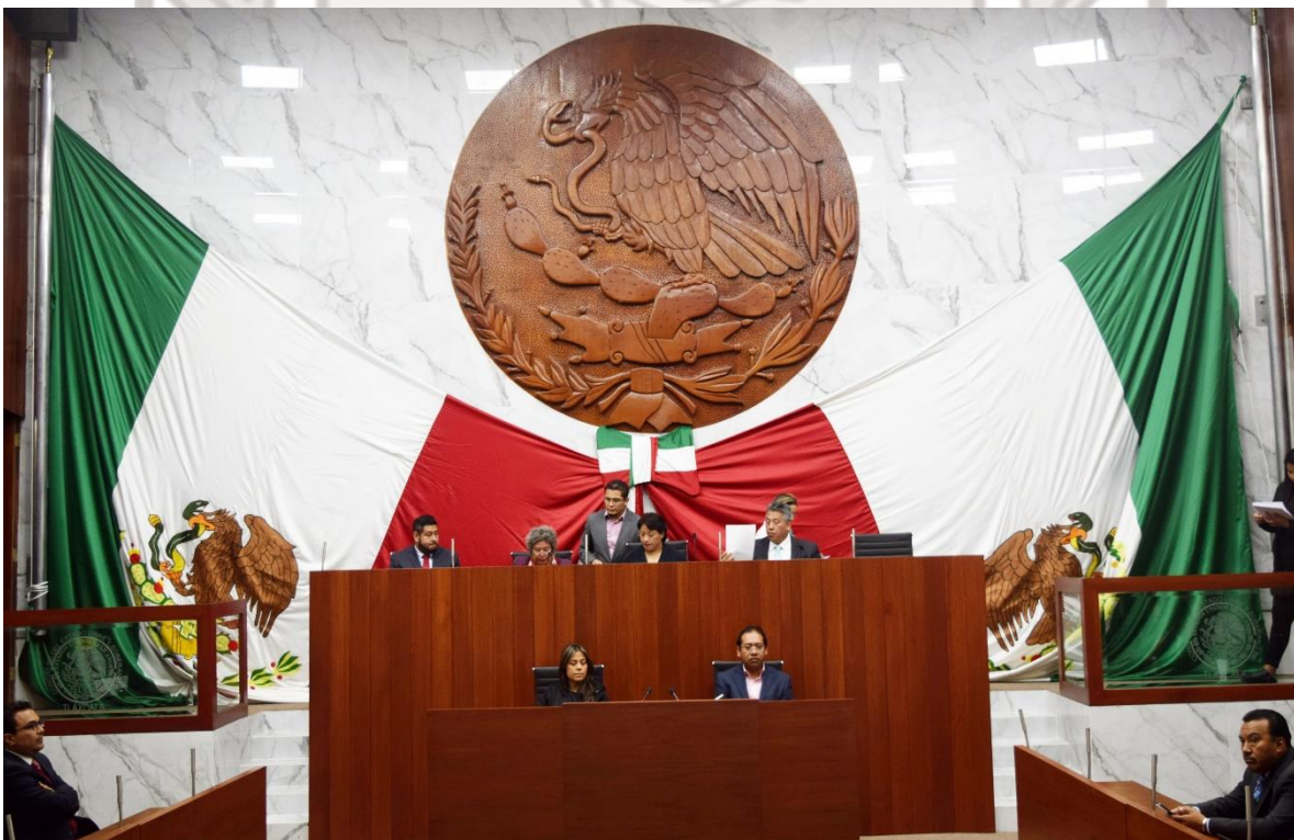
Apertura e inicio del Primer Periodo Ordinario de Sesiones del segundo año de ejercicio legal, de la Sexagésima Segunda Legislatura del Congreso del Estado.

Segundo Periodo Ordinario de Sesiones Primer Año de Ejercicio Legal LXII Legislatura 15 de enero 2018 No. de Gaceta; LXII15012018/A Sesión Extraordinaria Pública y Solemne