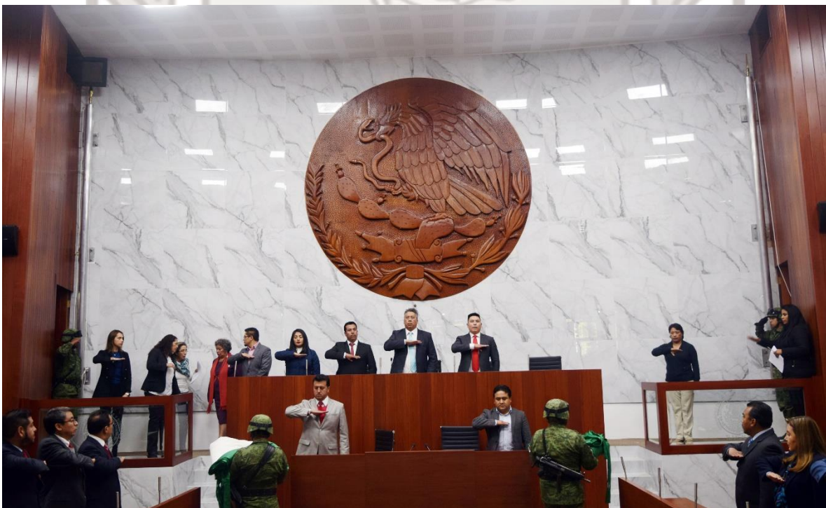
ÚNICO. Fijación de la Bandera Mexicana en la Sala de Sesiones.

Segundo Periodo Ordinario de Sesiones Primer Año de Ejercicio Legal LXII Legislatura 15 de enero 2018 No. de Gaceta; LXII15012018/S Sesión Extraordinaria Pública y Solemne