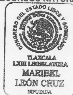
DIPUTADA MARIBEL LEÓN CRUZ.

Calle Ignacio Allende #31, Centro, 90000, Tlaxcala, Tlax. Tel. 01 (246) 689 3133