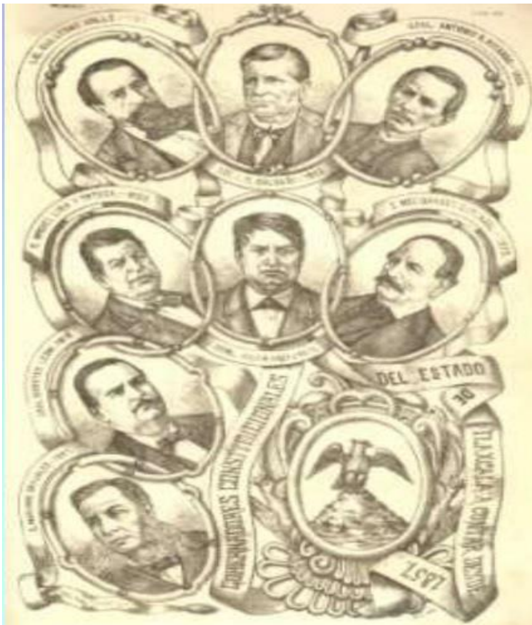
INTEGRANTES DE LA I LEGISLATURA DEL HONORABLE CONGRESO DEL ESTADO DE TLAXCALA.