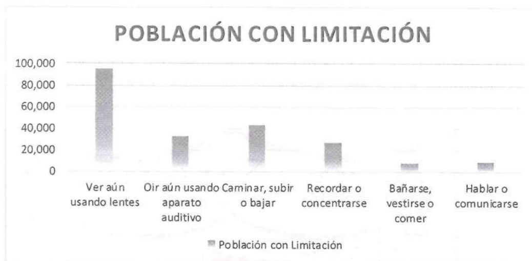
Figura 3. Elaboración propia de acuerdo a los datos proporcionados por el Censo de Población y Vivienda 2020, que presenta el Instituto Nacional de Estadística y Geografía en 2020.

El Convenio 159 de la Organización Internacional del Trabajo (OIT), ratificado por México, establece que la contratación en materia laboral se basará en la implementación de políticas que busquen cumplir con el principio de igualdad de oportunidades entre los trabajadores regulares y los trabajadores que cuenten con alguna discapacidad. En 2014, el Comité sobre los Derechos de las Personas con Discapacidad de la Organización de las Naciones Unidas, había manifestado a México su preocupación ante la baja tasa de empleo que existe entre las personas con discapacidad, especialmente aquellos que sufren discapacidad intelectual y psicosocial, por lo que se recomendó el fortalecimiento de programas que permitan que las personas que tienen alguna discapacidad accedan a un empleo mediante el establecimiento de mecanismos de monitoreo del cumplimiento de la cuota laboral en el sector público y privado. En