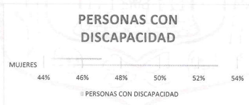
Figura 1. Elaboración propia de acuerdo a los datos proporcionados por el Censo de Población y Vivienda 2020, que presenta el Instituto Nacional de Estadística y Geografía en 2020.

México fue el primer país promotor de la Convención sobre los Derechos de las Personas con Discapacidad y su Protocolo Facultativo, el cual establece que los Estados parte deberán promover el respeto y eliminar cualquier forma de discriminación hacia las personas que tienen alguna discapacidad, para así garantizar la equidad e igualdad en todos los aspectos en los que las personas con discapacidad se desenvuelvan. Nuestro país siendo uno de los estados parte, firmó la Convención el 30 de marzo del año 2007, siendo ratificada su adhesión en diciembre del mismo año, convirtiéndose así, en parte de los estados comprometidos a proteger y promover los derechos y la dignidad de las personas, así como la igualdad y eliminar cualquier forma de discriminación. De acuerdo al Censo de Población y Vivienda publicado en 2020 por el Instituto Nacional de Estadística y Geografía, en México, existen aproximadamente 6,179,890 personas con algún tipo de discapacidad, lo que representa el 4.9% de la población total del país, de la cual el 53% son mujeres y el 47% son hombres.