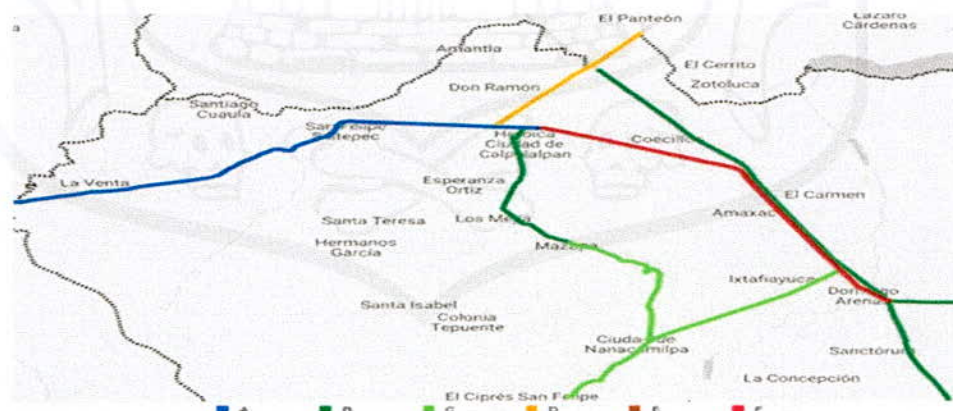
Niveles de Servicio

Dictamen con proyecto de Decreto, derivado del expediente parlamentario número LXIV 028/2024.